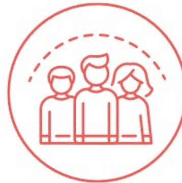
Sostenibilidad 'azul', turismo social y cultura

A more social Europe – implementing the European Pillar of Social Rights