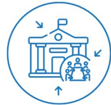
Una mejor gobernanza para la cooperación

A more social Europe – implementing the European Pillar of Social Rights