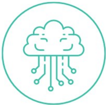
Innovación azul y competitividad

A smarter Europe – innovative and smart economic transformation