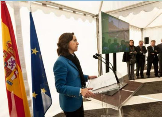
Acto de puesta en servicio de la nueva variante en la carretera A-405 a su paso por la Estación de San Roque, con la presencia de Rosa Aguilar (anterior Consejera de Obras Públicas y Transportes)