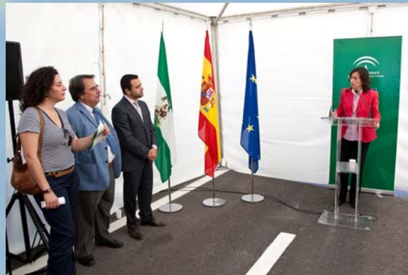
Acto para la variante de las Cabezas de San Juan en la A-471, Sevilla.