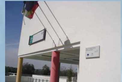
CEIP Santo Domingo de Silos de Bormujos, Sevilla.