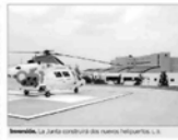
Málaga. La Junta invertirá 520.000 euros para mejorar los servicios sanitarios en Málaga.

La Empresa Pública de Emergencias Sanitarias (ESES) de la provincia de Málaga, a través de la Corporación de Salud de la provincia de Málaga, ha anunciado que se renovarán seis unidades móviles de Urgencias de Urgencias (UVI) en la provincia de Málaga, además de la construcción de dos nuevos helipuertos que se ubicarán en el término municipal de Bermejo y en el término municipal de San Pedro de Alcázar. Estas actuaciones forman parte de un programa de inversión de 520.000 euros que se ejecutará durante el presente año. Las nuevas UVI, que serán de nueva concepción, se fabricarán en el taller de fabricación de la ESES en San Pedro de Alcázar. Estas unidades móviles de Urgencias de Urgencias (UVI) son vehículos especializados en el transporte de pacientes de urgencia que requieren atención médica inmediata. Estas unidades están equipadas con todo el material necesario para atender a un paciente en cualquier momento y lugar. Las nuevas UVI, que serán de nueva concepción, se fabricarán en el taller de fabricación de la ESES en San Pedro de Alcázar. Estas unidades móviles de Urgencias de Urgencias (UVI) son vehículos especializados en el transporte de pacientes de urgencia que requieren atención médica inmediata. Estas unidades están equipadas con todo el material necesario para atender a un paciente en cualquier momento y lugar.