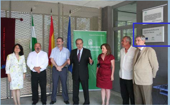
Inauguración de las nuevas instalaciones del IES Manuel de Góngora en Tabernas, Almería. (con la presencia del delegado de Educación de Almería y el alcalde de Tabernas)