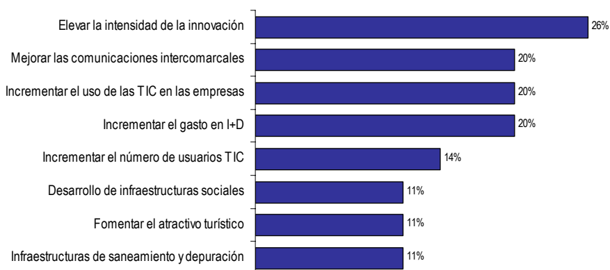
Gráfico 1 Objetivos intermedios según su capacidad de influencia sobre los restantes

Nota: El porcentaje está calculado sobre el máximo posible, es decir que cada objetivo tuviera una influencia total sobre todos los restantes